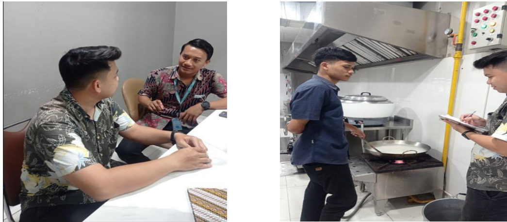
Gambar 2 Dokumentasi wawancara 2024

Komponen penting dari perawatan yang berpusat pada pasien di rumah sakit adalah penyediaan makanan dan perawatan gizi. Hal ini berkaitan dengan perubahan kebutuhan makanan pasien seiring dengan perkembangan penyakit selama terapi. Malnutrisi sering kali digambarkan sebagai konsekuensi dari masalah klinis yang muncul di fasilitas medis. Melemahnya sistem kekebalan tubuh, komplikasi penyakit, peningkatan jumlah pasien yang masuk kembali ke rumah sakit, dan bahkan kematian dapat disebabkan oleh kekurangan gizi