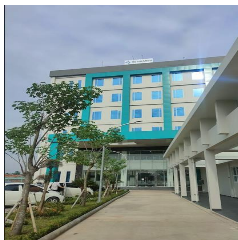
Gambar 1: RS Hastien Rengasdengklok 2024

Instalasi Gizi adalah unit yang mengelola kegiatan pelayanan gizi di rumah sakit sebagai wadah untuk melakukan pelayanan makanan, pelayanan terapi diet dan penyuluhan/konsultasi gizi meliputi: Penyelenggaraan makanan: Sistem pengadaan makanan dimulai dari pemilihan bahan makanan mentah berkualitas baik hingga menjadi makanan siap santap. Rumah Sakit Hastien devisi instalasi gizi memiliki jumlah pegawai sekitar 12 karyawan terdiri dari 7 laki-laki dan 5 perempuan. Rumah sakit hastien bagian instalasi gizi masih sangat kekurangan karyawan, sehingga tidak dapat memberikan pelayanan gizi kepada pasien dengan baik.