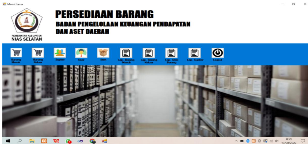
Gambar 3 Halaman utama aplikasi

Pembuatan aplikasi mengikuti hasil analisis dan desain yang dibahas sebelumnya berjalan dengan baik. Pada halaman utama ini dapat mengakses menu barang masuk, barang keluar, supplier, user, stok, laporan barang, laporan barang keluar, laporan stok barang dan laporan supplier. Berikut ini tampilan halaman utama aplikasi dapat dilihat pada gambar 3 Menu-menu dapat digunakan untuk memulai pengisian data.