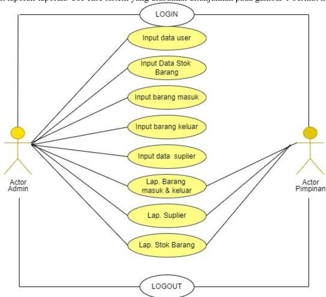
Gambar 1 Diagram Use Case

Berdasarkan kebutuhan sistem diatas, beberapa analisis sistem yang dilakukan untuk membangun kerangka perilaku sistem dengan use case diagram, activity diagram dan sequence diagram dan juga struktur pendukung sistem seperti class diagram dan ER Diagram. Menggunakan use case, sistem yang diusulkan digambar dengan dua aktor sebagai penggunanya. Aktor admin dapat menggunakan input data user, data stok barang, barang, barang keluar, data supplier, laporan barang masuk dan keluar, laporan supplier dan laporan stok barang. Sedangkan aktor pimpinan hanya dapat melihat laporan-laporan. Use case sistem yang diusulkan ditunjukkan pada gambar 1 berikut ini.