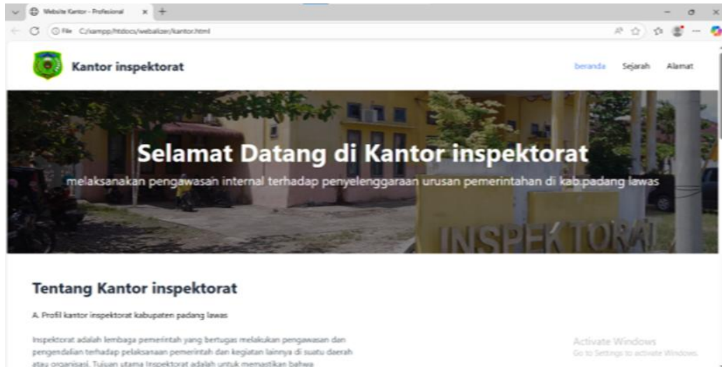
Gambar 2. Beranda