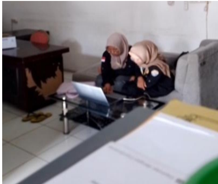
Gambar 1. Rapat Pembuatan Website.

Transpormasi digital dalam pengelolaan mengaudit rutin tidak hanya bertujuan untuk mempercepat proses pencatatan, tetapi juga untuk memastikan kemudahan akses informasi bagi berbagai pemangku.