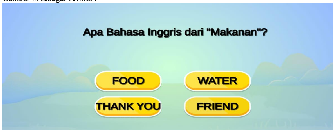
Gambar IV.8. Scene Kuis

Tampilan yang disajikan oleh sistem untuk menampilkan Scene kuis dapat dilihat pada Gambar 8. sebagai berikut :