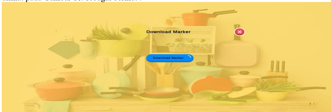
Gambar 10. Scene Download Marker

Tampilan yang disajikan oleh sistem untuk menampilkan Scene download marker, dapat dilihat pada Gambar 10. sebagai berikut :