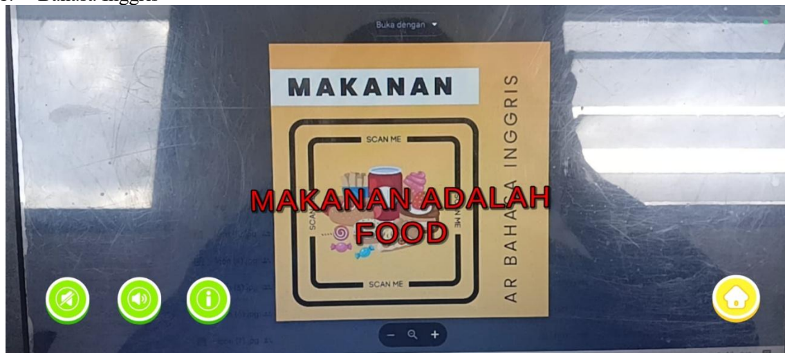
Gambar 3. Scene Scan Marker Makanan