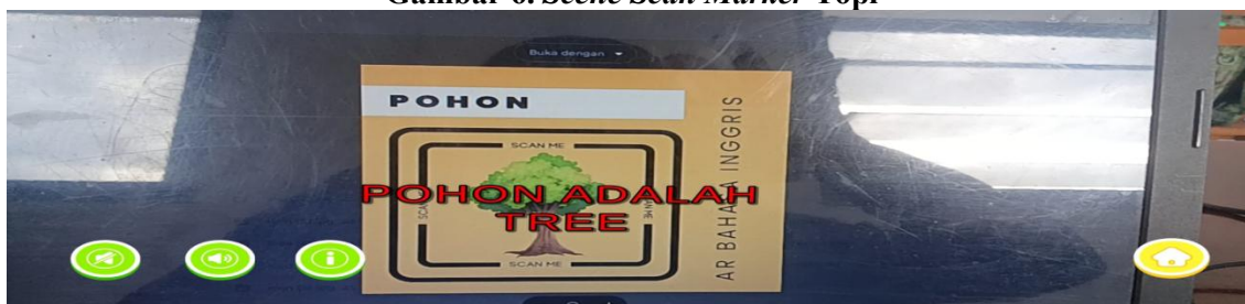
Gambar 7. Scene Scan Marker Pohon

Scene Scan Marker AR digunakan untuk melakukan proses Augmented Reality pembelajaran bahasa inggris. Adapun langkah awalnya yaitu pengguna melakukan scan pada marker yang telah dibuat sebelumnya, dan selanjutnya objek 3D akan ditampilkan pada layar smartphone android . Pada scene ini terdapat 3 tombol yang dapat digunakan oleh pengguna. Tombol back digunakan untuk kembali ke menu utama, tombol sound digunakan untuk menghasilkan output deskripsi dalam bentuk suara, dan tombol info digunakan untuk menampilkan panel deskripsi yang berisi informasi keseluruhan dari objek 3D.