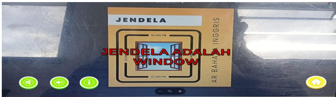
Gambar 5. Scene Scan Marker Jendela