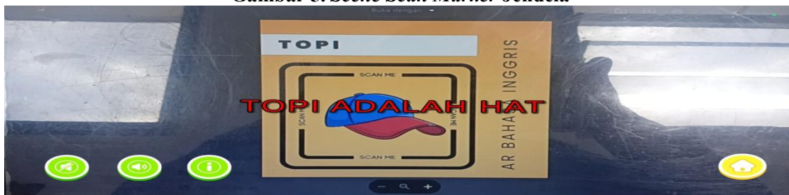
Gambar 6. Scene Scan Marker Topi