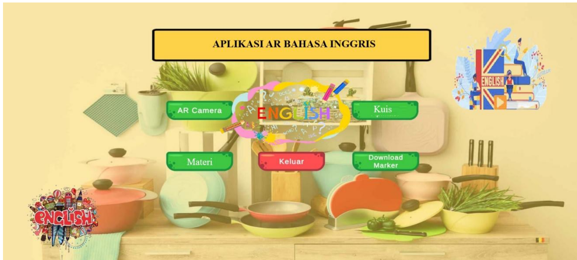
Gambar 2. Scene Menu Utama

Scene menu utama pada gambar 2. merupakan scene yang ditampilkan ketika pengguna pertama kali membuka aplikasi augmented reality pengenalan bahasa inggris. Pada scene menu utama terdapat 5 tombol yaitu tombol mulai yang digunakan untuk menampilkan scene scan marker Augmented Reality , tombol AR cam yang digunakan untuk menampilkan scene Augmented Reality , tombol kuis untuk menampilkan kuis, materi digunakan untuk menampilkan materi pembelajaran, download marker digunakan untuk mendownload marker pembelajaran dan keluar digunakan untuk keluar dari aplikasi.