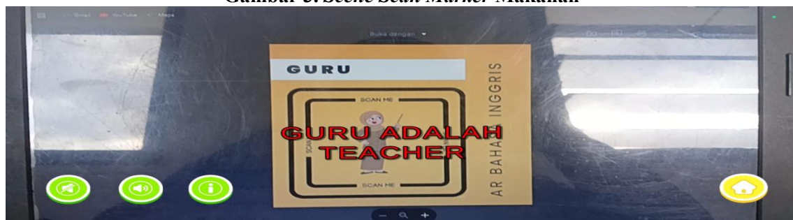
Gambar 4. Scene Scan Marker Guru