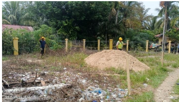
Gambar 7. Pembangunan Ruang Labor Komputer dan ruang UKS

Selain rehabilitasi bangunan eksisting, hasil perencanaan juga mencakup pembangunan bangunan baru berupa ruang laboratorium, ruang UKS, dan toilet siswa. Perencanaan pembangunan bangunan baru disesuaikan dengan kebutuhan sekolah serta ketentuan dimensi dan standar teknis yang tertuang dalam panduan pelaksanaan Program REVIT Tahun 2025. Setiap bangunan dirancang dengan mempertimbangkan fungsi ruang, sirkulasi pengguna, serta integrasi dengan lingkungan sekolah yang sudah ada. Hasil perencanaan menunjukkan bahwa bangunan laboratorium dirancang untuk mendukung kegiatan praktikum secara optimal, ruang UKS difungsikan sebagai fasilitas layanan kesehatan sekolah, dan toilet siswa dirancang memenuhi standar sanitasi serta aksesibilitas. Seluruh bangunan baru direncanakan menggunakan struktur sederhana namun kokoh, dengan material yang mudah diperoleh dan sesuai dengan kondisi lingkungan setempat.