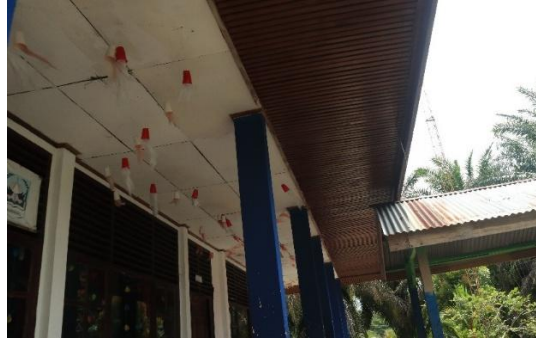
Gambar 5. Kondisi Plafon Ruang Kelas

Hasil perencanaan rehabilitasi ruang kelas difokuskan pada peningkatan kualitas fungsi ruang tanpa mengubah struktur utama bangunan secara signifikan. Berdasarkan evaluasi teknis, pekerjaan rehabilitasi meliputi penggantian penutup atap, perbaikan plafon, penggantian lantai, peremajaan pintu dan jendela, pengecatan ulang dinding, serta pembaruan instalasi listrik. Pendekatan ini dipilih untuk menjaga efisiensi biaya sekaligus memastikan bangunan memenuhi standar kenyamanan dan keselamatan bagi peserta didik dan tenaga pendidik. Perubahan desain juga memperhatikan aspek estetika dan aksesibilitas, termasuk penambahan ramp bagi penyandang disabilitas serta peningkatan pencahayaan dan penghawaan alami. Dengan perencanaan ini, ruang kelas diharapkan mampu menunjang proses pembelajaran yang lebih kondusif dan berkelanjutan.