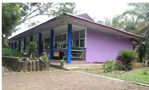
Gambar 3. Tampak Samping Kanan Ruang Kelas Sebelum Direhabilitasi

Berdasarkan hasil survei lapangan yang dilakukan pada SMP Negeri 1 Koto Besar, diketahui bahwa beberapa bangunan sekolah berada dalam kondisi yang memerlukan penanganan segera, baik berupa rehabilitasi maupun pembangunan baru. Kondisi eksisting menunjukkan adanya ruang kelas dan ruang laboratorium yang mengalami kerusakan fisik pada elemen arsitektural dan utilitas bangunan, seperti plafon yang rusak, lantai yang pecah, instalasi listrik yang sudah tidak layak, serta penurunan kualitas material akibat usia bangunan. Kondisi ini berdampak langsung pada kenyamanan dan keamanan proses belajar mengajar.