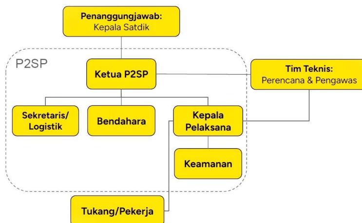
Gambar 2. Tim Penyelenggara REVIT pada Satuan Pendidikan