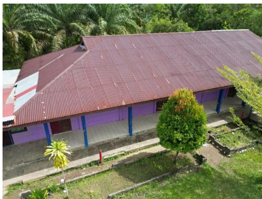
Gambar 4. Tampak Atas Ruang Kelas Sebelum Direhabilitasi