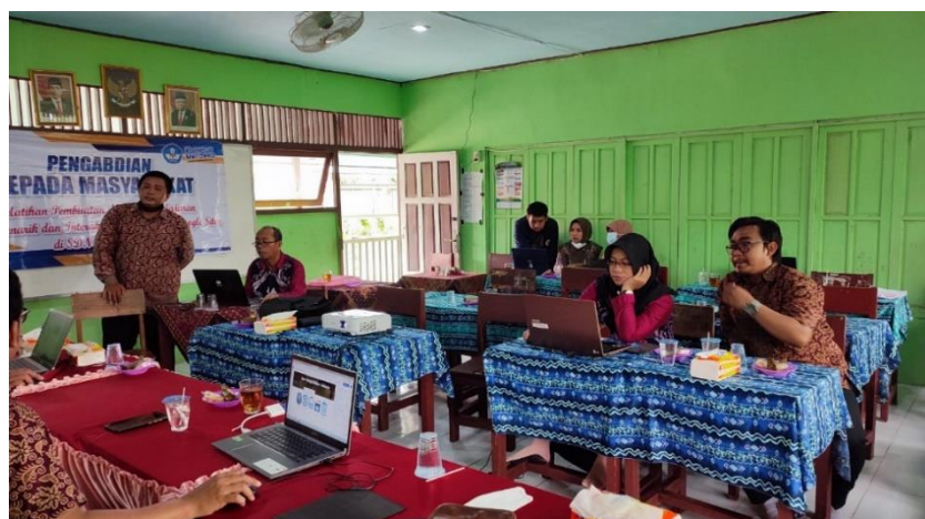
Gambar 2. Praktek dan Pendampingan

Praktek langsung oleh para guru tentang pembuatan google site dan di dampingi oleh para dosen dan mahasiswa