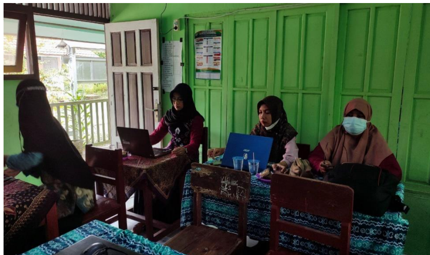
Gambar 4. Praktek mandiri

Praktek mandiri yang dilakukan oleh guru