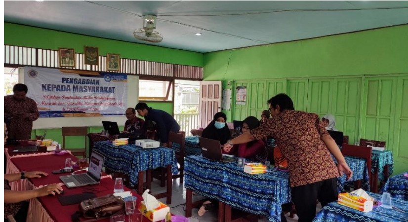
Gambar 3. Praktek dan pemdampingan