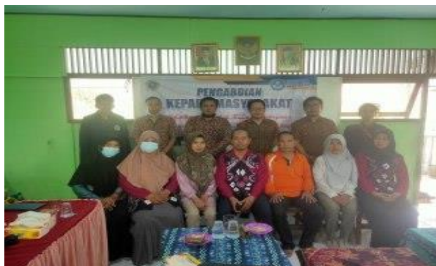
Gambar 5. Foto Bersama selesai acara