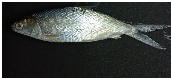
Gambar 3. Ikan Bandeng dengan Latar Belakang Warna Hitam.

Akuisisi citra adalah tahapan dimana peneliti mengambil data berupa citra ikan bandeng. Pengambilan citra ikan bandeng dilakukan menggunakan kamera smartphone. Ikan bandeng difoto dari jarak kurang lebih 30 cm atau sampai kelihatan seluruh badan ikan. Kemudian citra disimpan dalam format JPEG. Selain kamera smartphone, alat yang digunakan adalah studio mini, lampu led, dan tripod. Warna latar belakang studio mini yang digunakan adalah warna hitam. Gambar ikan bandeng dengan latar belakang warna hitam ditunjukkan pada Gambar 3.