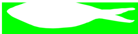
Gambar 4. Gambar Masking Citra Ikan Bandeng.

Proses masking bertujuan untuk menutupi latar belakang citra ikan bandeng sehingga pada proses ekstraksi fitur jadi lebih mudah. Masking yang digunakan adalah citra dengan latar belakang warna hijau. Citra masking ikan bandeng ditunjukkan pada Gambar 4. Proses berikutnya adalah pemotongan (cropping). Citra akan dipotong (cropping) pada bagian tepi ikan dengan jarak sekitar 10 pixel. Pemotongan digunakan untuk mengurangi latar belakang warna hijau supaya tidak terlalu lebar. Citra ikan bandeng yang mengalami praproses ditunjukkan pada Gambar 5.