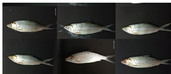
Gambar 1. Citra Ikan Bandeng.

Data yang digunakan pada penelitian ini adalah data citra bandeng. Bandeng yang digunakan ada dua jenis yaitu yang bandeng segar dan bandeng tidak segar. Setiap ikan bandeng diambil citranya sebanyak tiga kali sehari yaitu pada saat pagi, siang, dan sore. Pengambilan citra tadi diulangi selama tiga hari. Pada awalnya ikan bandeng yang segar tadi mengalami degradasi menjadi tidak segar lagi. Terdapat sebanyak 21 ikan bandeng sebagai sampel. Total keseluruhan terdapat 189 citra ikan bandeng. Beberapa citra ikan bandeng ditunjukkan pada Gambar 1.