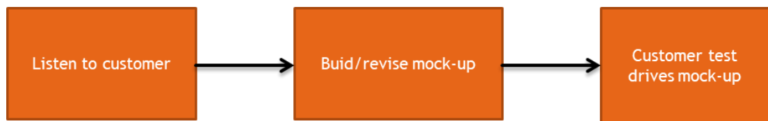
Gambar III. 1 Proses pengembangan menggunakan metode prototype

Model prototype adalah skalabilitas, model, ataupun standar ukuran yang dibentuk berdasarkan suatu skema rancangan sistem.