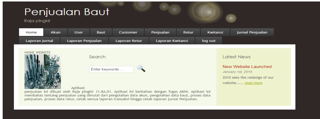
Gambar III. 4 Form menu utama

Form menu utama merupakan form utama untuk memanggil seluruh form lainnya dan melalui form ini aplikasi dapat dijalankan.