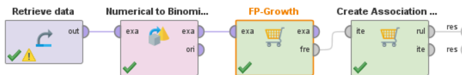
Gambar 2 Proses Pemodelan

Pada tahapan ini peneliti akan menentukan nilai support dengan menggunakan minimum support 17% kemudian memasukan data yang sudah berbentuk tabular dan siap diolah pada rapid miner berikut adalah prosesnya: