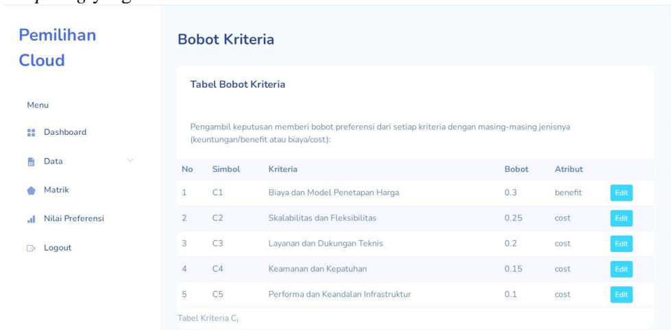
Gambar 1. Menentukan Bobot Kriteria

Berikut ini adalah bentuk implementasi dari Sistem Penunjang Keputusan (SPK) berbasis metode Simple Additive Weighting (SAW) untuk membantu pengguna dalam menentukan layanan cloud computing yang terbaik.