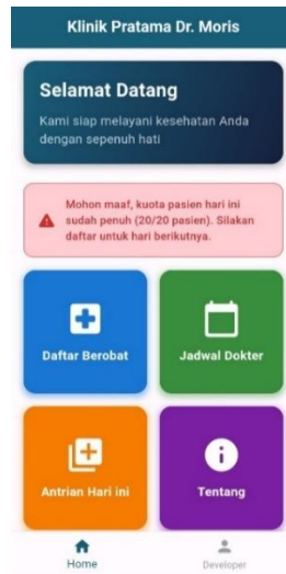
Gambar 2. Halaman Beranda Pasien