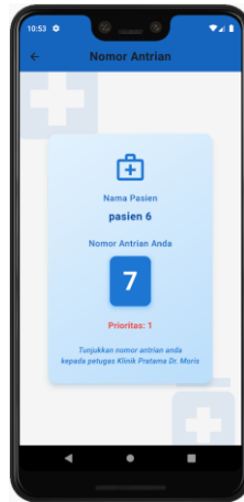
Gambar 4. Halaman Nomor Antrian Pasien