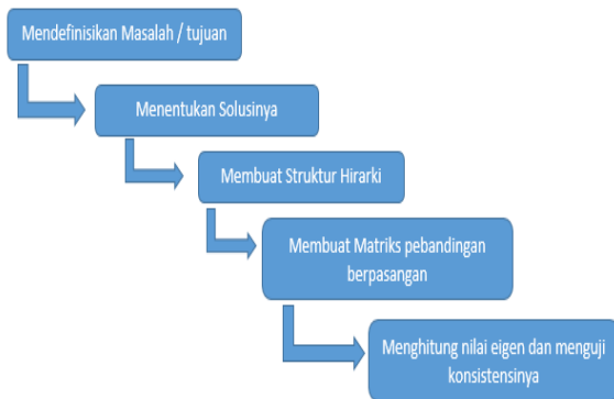
Gambar 3.1 Diagram Alir metode AHP (Suryadi, 2000)

Pada dasarnya langkah-langkah dalam metode AHP meliputi :